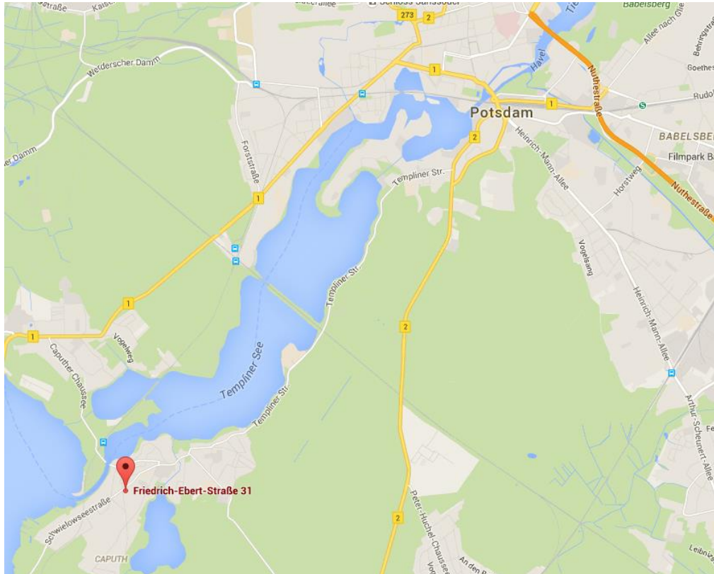
Lage von Schwielowsee/Caputh